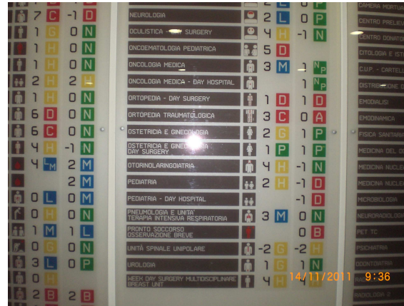
1 ος όροφος