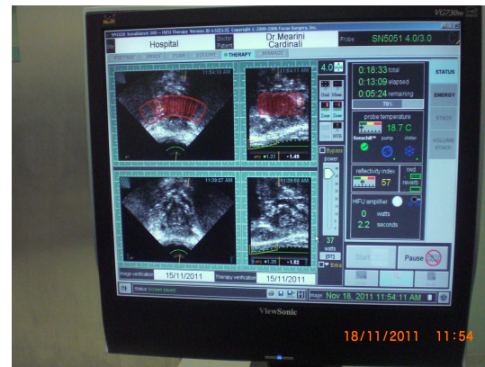
Σύγχρονη τεχνολογία (HIFU)