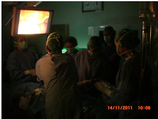
Μεγάλο φάσμα επεμβάσεων